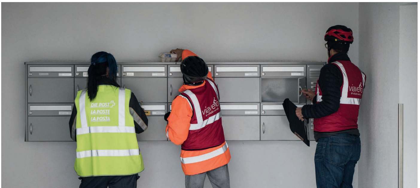
Den Atelier-Manus-Velokurierdienst ViaVelo gibt es erst seit Frühling 2022. Er erfreut sich bereits grosser Beliebtheit.

Der «Walliser Bote» hat eine Eiertour begleitet.