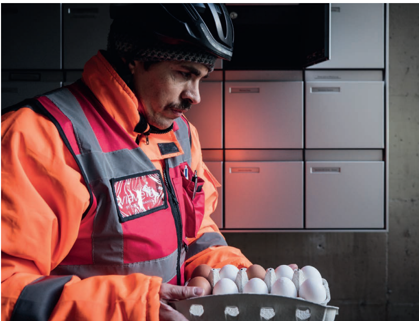
Letzte Kontrolle auf Vollständigkeit, bevor die Eier in den Milchkasten des Kunden gelegt werden.